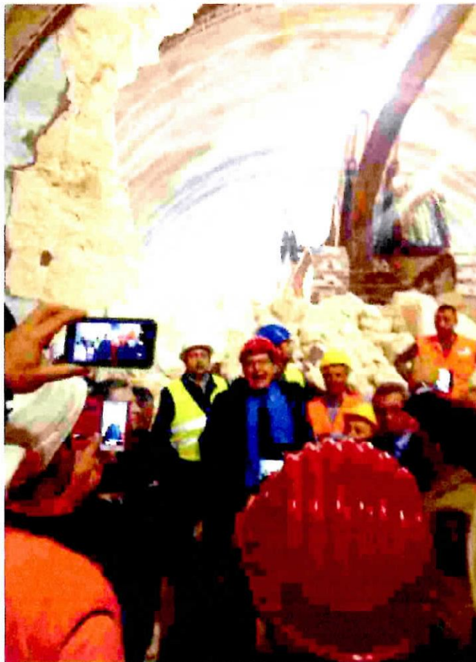
Al centro il presidente alla cerimonia di ieri alla galleria Mandriavecchia

Ed intorno alle 13 ieri la grande macchina perforatrice della ditta Cossi (un'azienda della Brianza esperta in costruzione della gallerie) ha acceso i motori per abbattere la parete della grande bocca della galleria. La realizzazione dell'autostrada è della Cosige, cioè del raggruppamento temporaneo di imprese formato da Condotte spa e Cosedil spa. Le percussioni dei colpi del grosso martello meccanico si sono sentite per circa un quarto d'ora, quanto è bastato per divorare quell'ultimo dia-